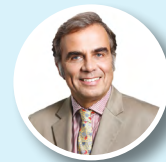
Ludwig W. Willisch