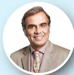
Ludwig W. Willisch